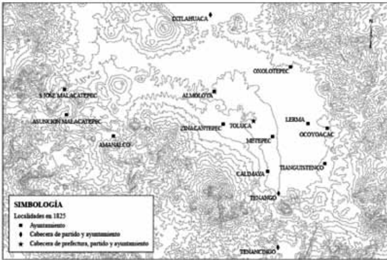
ILUSTRACIÓN 1. Organización estatal de la prefectura de Toluca en 1825*

* Ilustración elaborada por el Departamento de Sistemas de Información Geográfica de El Colegio de México, con datos tomados del índice de pueblos de Dorothy Tanck de Estrada, Atlas ilustrado de los pueblos de indios. Nueva España, 1800. Mapas de Jorge Luis Miranda García y Dorothy Tanck de Estrada, con la colaboración de Tania Lilia Chávez Soto , México, El Colegio de México, El Colegio Mexiquense, Comisión Nacional para el Desarrollo de los Pueblos Indígenas, Fomento Cultural Banamex, 2005; y de “Núm. 1. Estado que manifiesta los pueblos donde hay ayuntamientos en virtud de la ley de 9 de febrero de 1825, con expresión de las prefecturas y cabeceras de partido a que están sujetos”, en Memoria en que el Gobierno del Estado Libre de México da cuenta de los ramos de su administración al Congreso del mismo Estado, a consecuencia de su decreto de 16 de diciembre de 1825. Impresa de orden del Congreso , México, Imprenta a cargo de Rivera, 1826, página sin número.